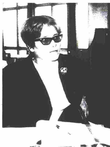
La giornalista e scrittrice Tina Merlin. A lato: militari scavano nel fango alla ricerca di superstiti dopo la tragedia del Vajont, nei pressi di Longarone, nell'ottobre 1963. Marco Paolini si è ispirato al libro di Merlin per il suo spettacolo "Il racconto del Vajont"