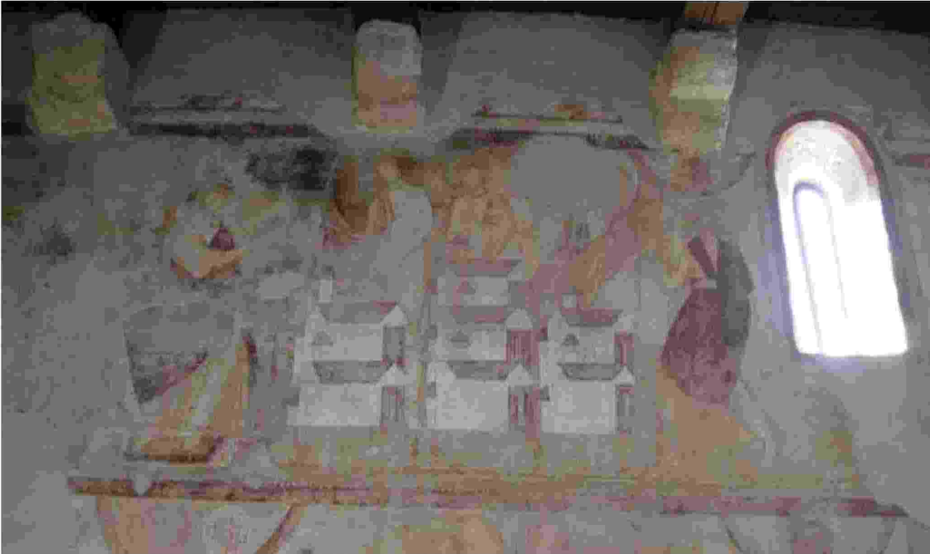
L'Apocalisse raccontata dai dipinti Un particolare degli affreschi all'interno della Chiesa di San Severo a Bardolino