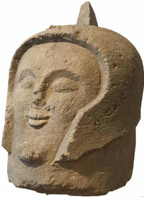
In alto: cippo del museo Faina; in basso: testa di vecchio.