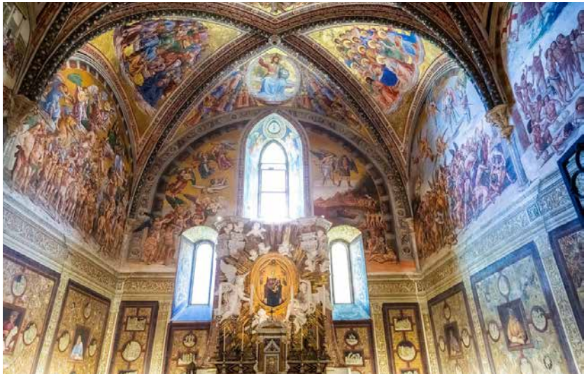
Cappella del Corporale e Cappella di San Brizio.