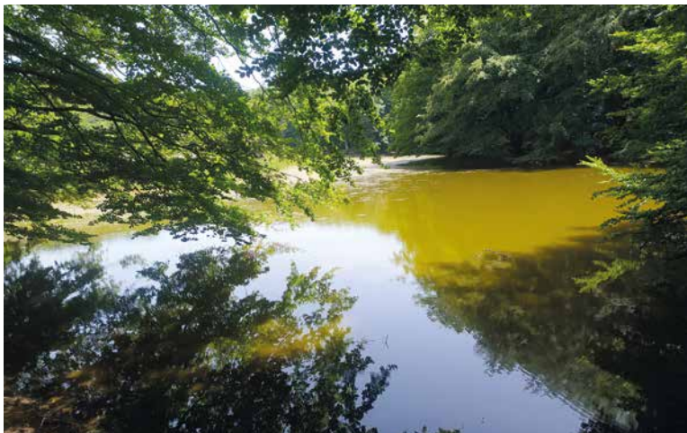
Sentiero valdese con lago.