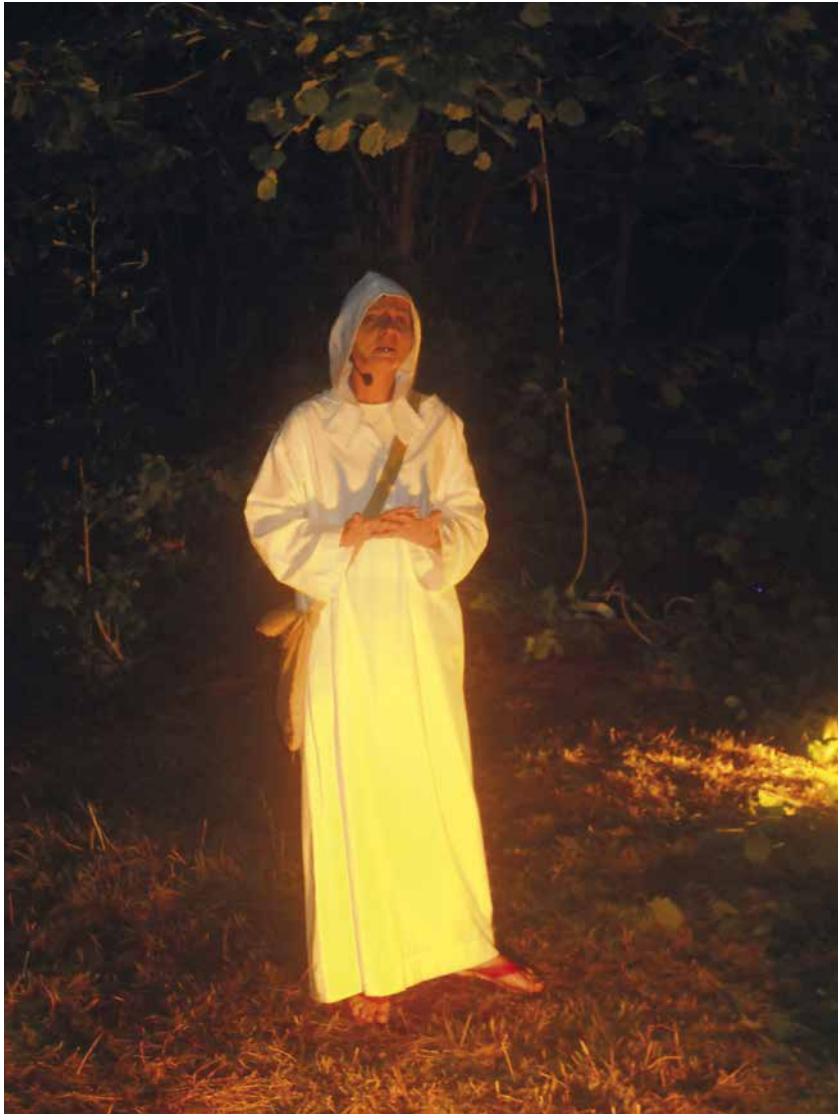
In alto: rappresentazione rievocativa di un cataro. Nella pagina a fianco: rievocazione di un inquisitore (in alto) e di un rogo (in basso).