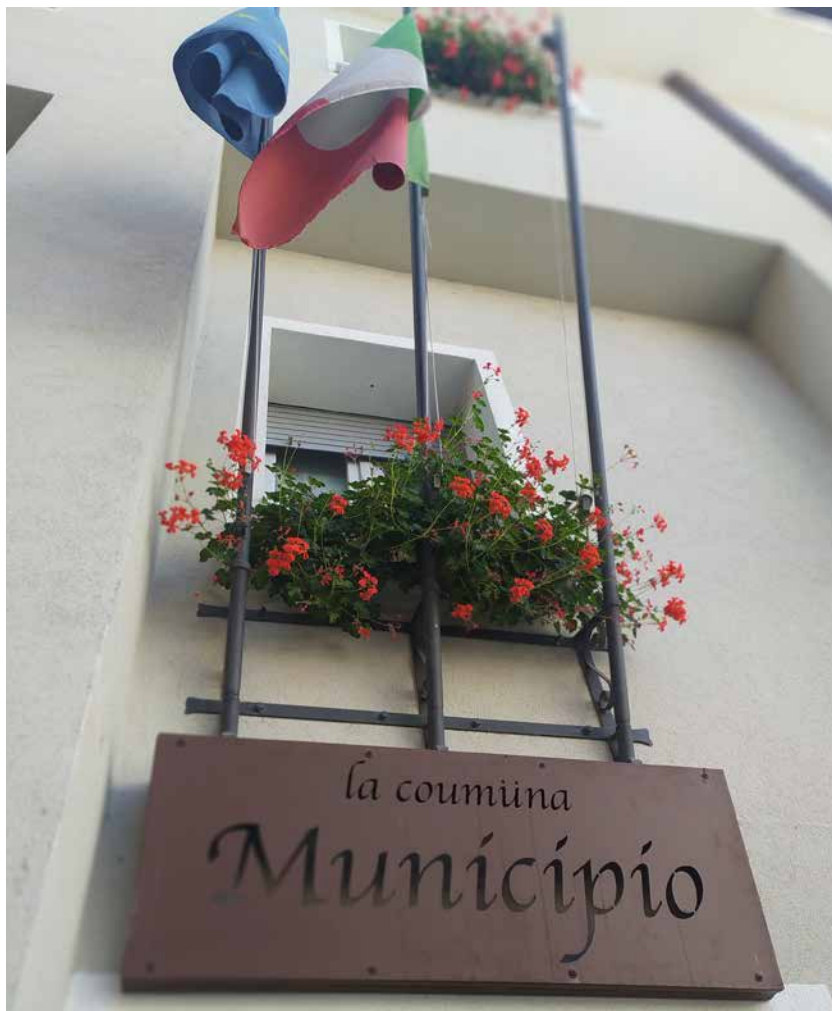
Municipio con scritta in occitano.