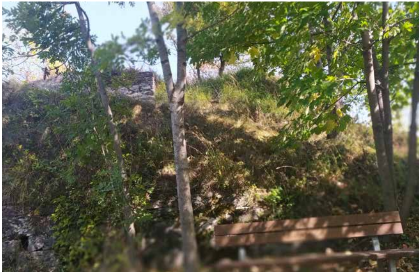
Resti della torre medievale e bosco sopra Roccavione.