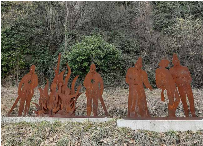
Riproduzioni in metallo della Rocca dei Catari e del rogo.