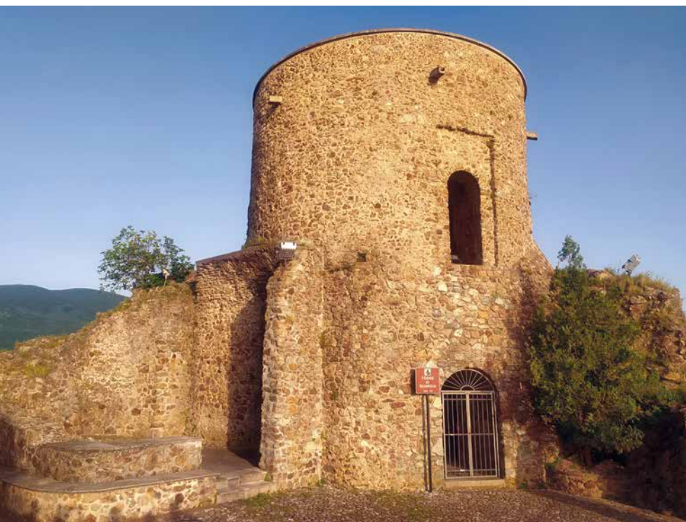
Porta del Sangue e Centro di Cultura G.L. Pascale; in basso: torre di guardia.