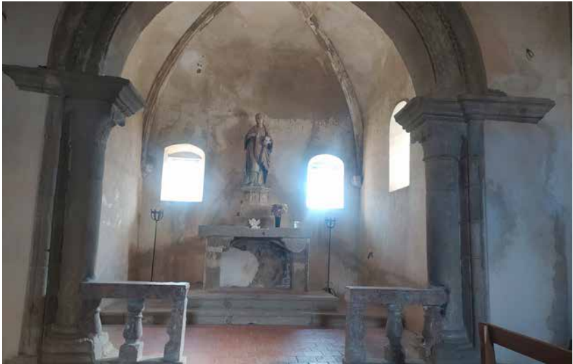
Chiesa catara di Santa Caterina.