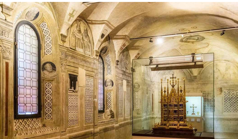
Museo dell'Opera del Duomo.