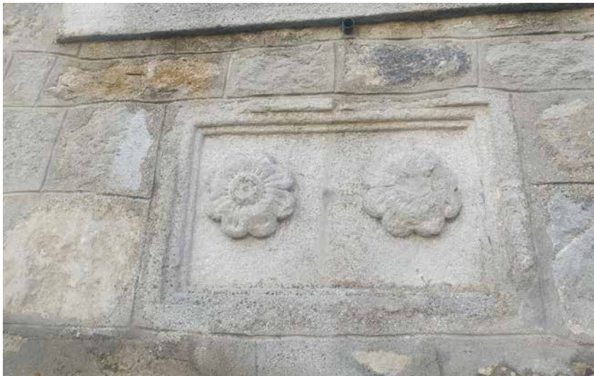
Chiesa catara di Santo Spirito.