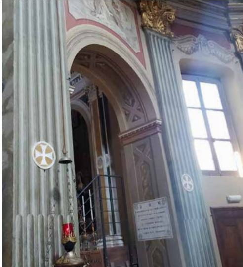
Interno della Chiesa della Confraternita di Santa Croce e dettaglio di croci occitane.