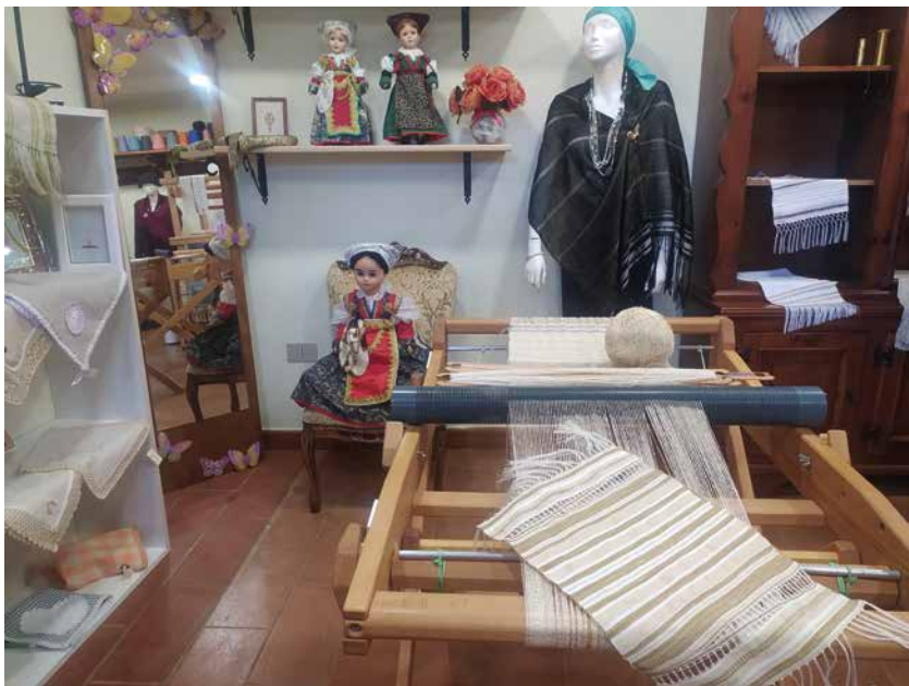
Centro di Cultura G.L. Pascale con laboratorio di tessitura