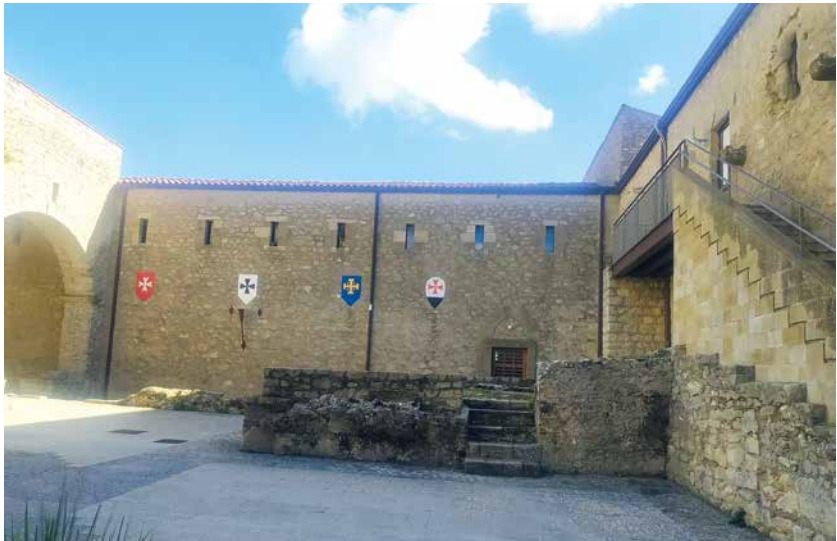
Castello medievale di Federico III.