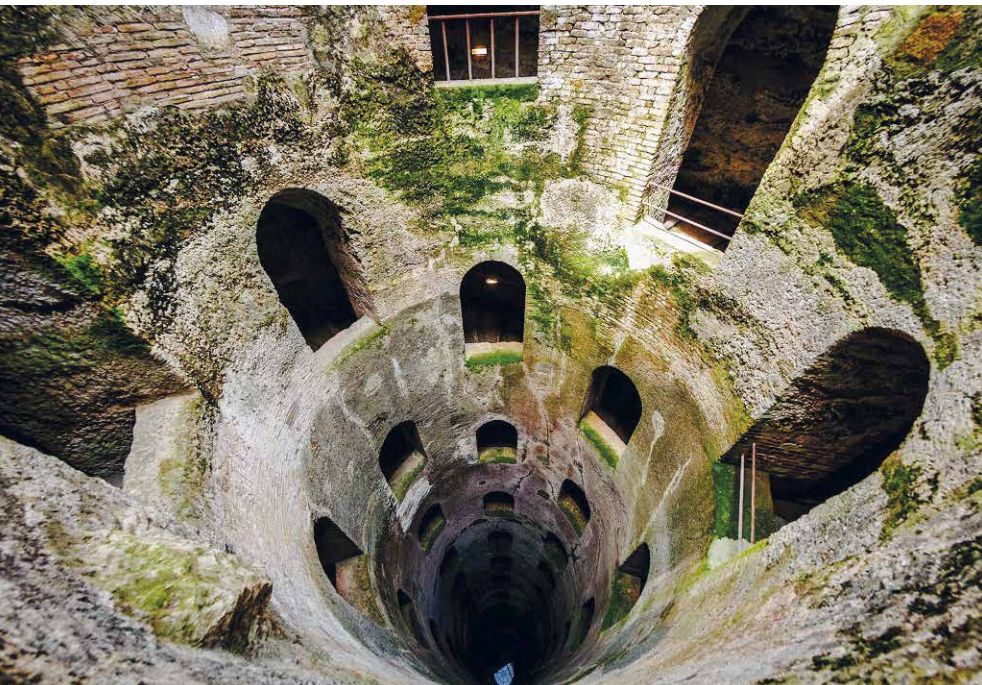
In alto: particolare delle mura esterne. In basso: pozzo di San Patrizio.