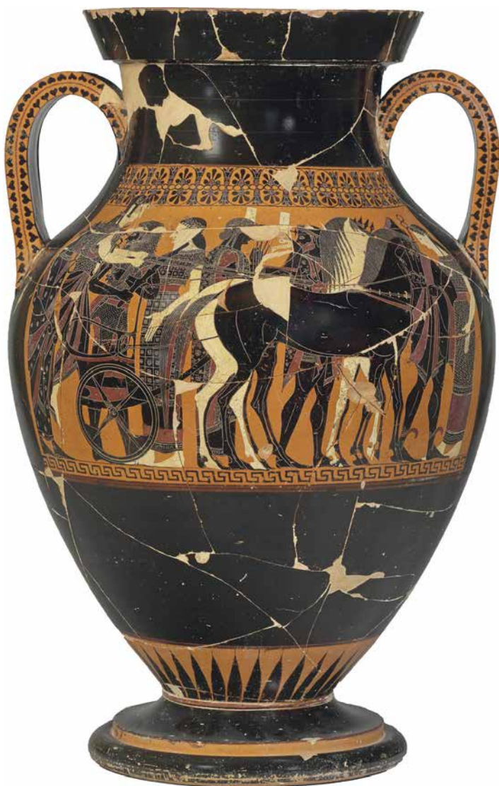
Vaso nel Museo etrusco "Claudio Faina".