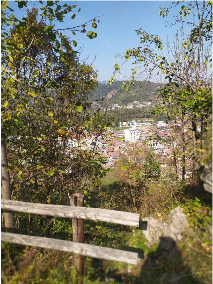
Panorama dalla roccia di San Sudario.