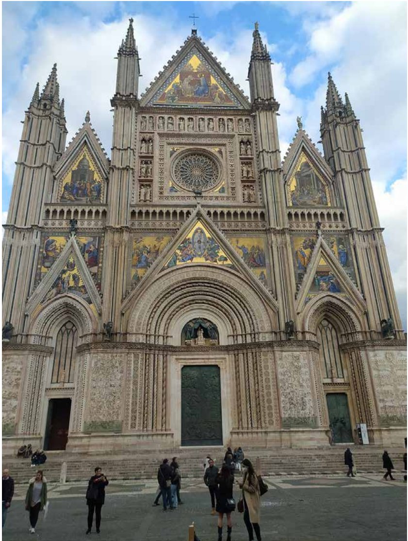
Facciata del Duomo.