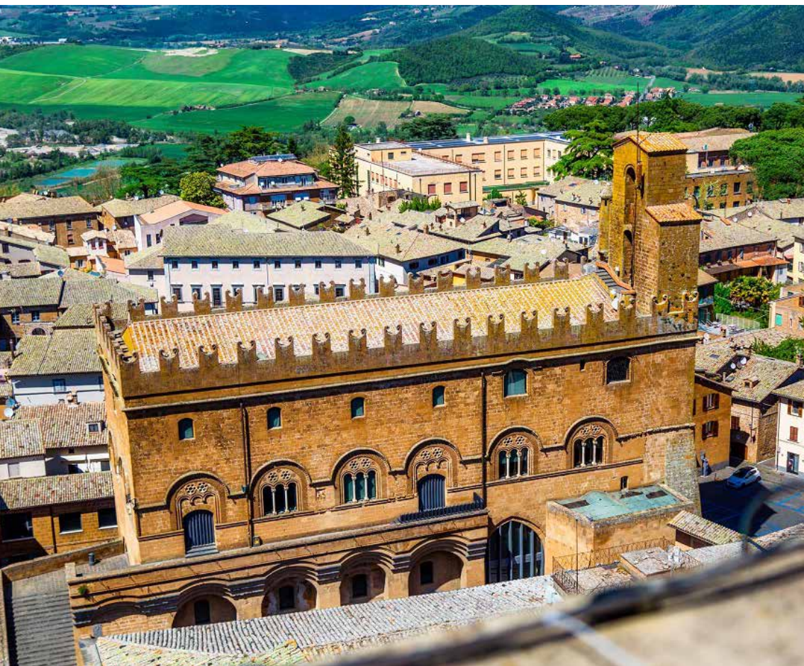
Il Palazzo del Capitano del Popolo.